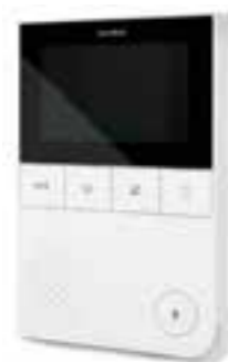
IP DOORBIRD A1101 MONITOR